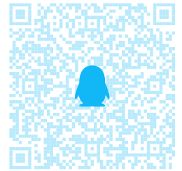
(d) QQ 支付